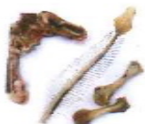
Restes de carn i peix