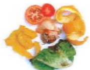
Restes de fruita i verdura