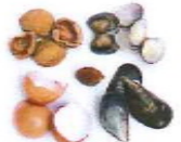
Closques d'ou, de marisc i de fruits secs