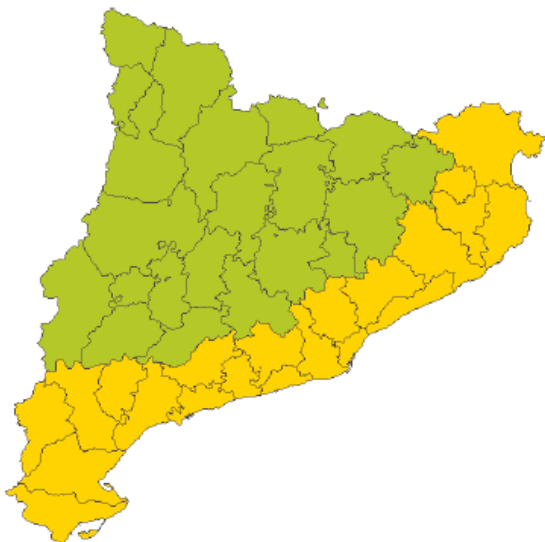
0-6 H T.U.