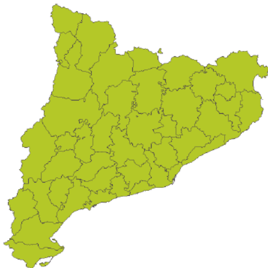
6-12 H T.U.