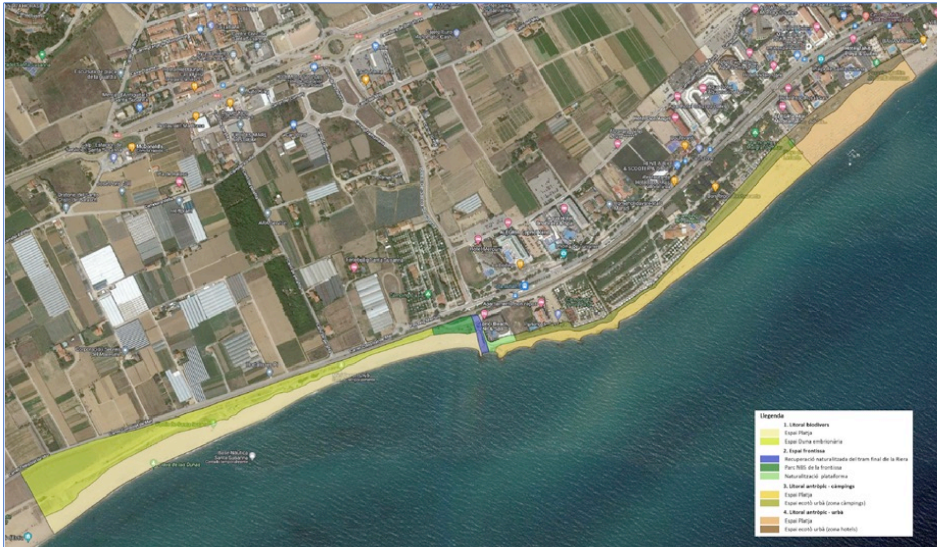
Imagen 1. Planteamiento base del litoral de Santa Susanna, atendiendo a la comprensión de Infraestructura Verde como marco de cualquier actuación que desde deba realiza en él.